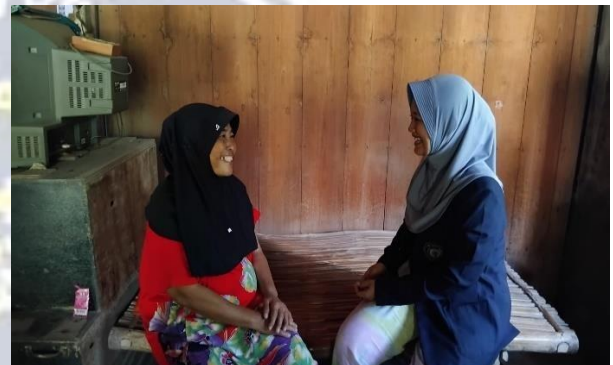
Pemberian Life Review Therapy