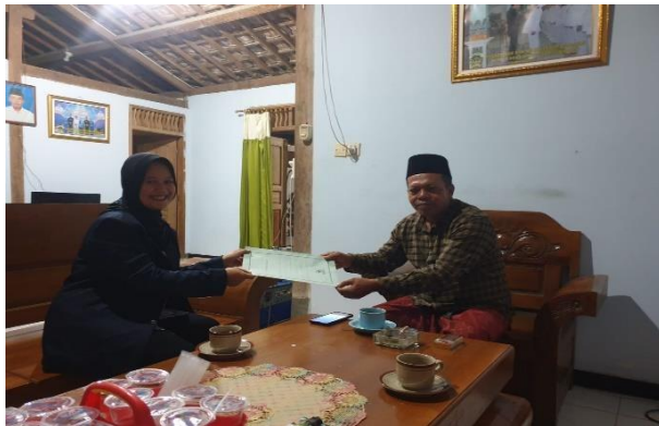
Pengambilan Data Awal