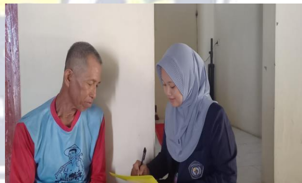
Membantu Pengisian Kuisoner ( Post Test)