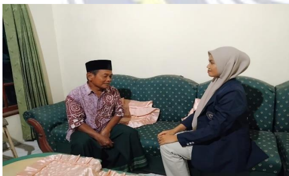
Pemberian Life Review Therapy (Pembantu Peneliti)