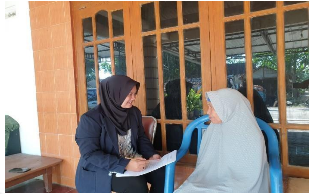
Membantu Pengisian Kuisoner (PreTest)