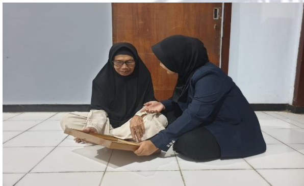
Pemberian Life Review Therapy